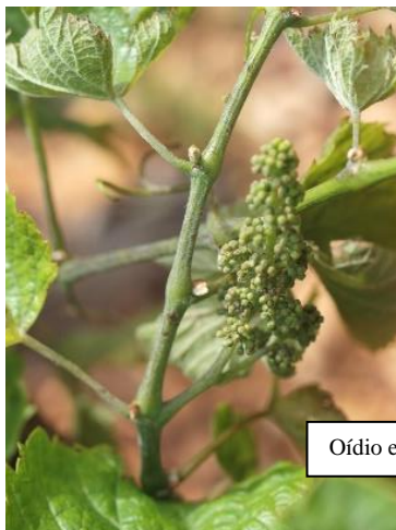
Oídio en pámpano, hojas y racimo.

Las materias activas recomendadas son varias, bien penetrantes o de contacto, (triazoles, estrobilurinas, azufre, ...) y se pueden consultar en la página web el Boletín de Avisos Fitosanitarios de la Rioja nº8 https://www.larioja.org/agricultura/es/publicaciones/boletin-avisos-fitosanitarios-2024