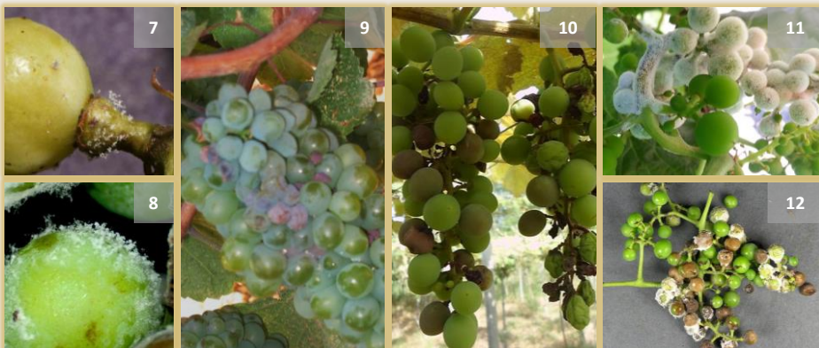
Síntomas en uvas y racimos