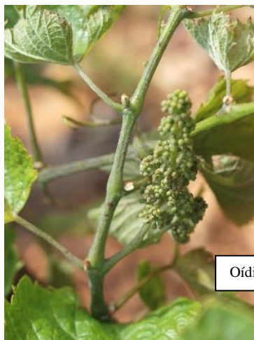
Oídio en pámpano, hojas y racimo.

Las materias activas recomendadas son varias, bien penetrantes o de contacto, (triazoles, estrobilurinas, azufre, ...) y se pueden consultar en la página web el Boletín de Avisos Fitosanitarios de la Rioja nº8 https://www.larioja.org/agricultura/es/publicaciones/boletin-avisos-fitosanitarios-2024