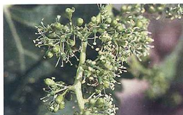
Plena floración (Estado I 2 )

Nota abreviaturas fenología: At -estado más atrasado, Fr -estado más frecuente, Av -estado más avanzado