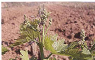
Racimos separados (Estado G)