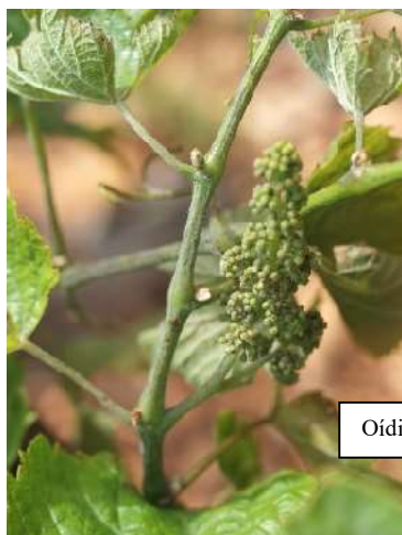
Oídio en pámpano, hojas y racimo.

Las materias activas recomendadas son varias, bien penetrantes o de contacto, (triazoles, estrobilurinas, azufre, ...) y se pueden consultar en la página web el Boletín de Avisos Fitosanitarios de la Rioja nº8 https://www.larioja.org/agricultura/es/publicaciones/boletin-avisos-fitosanitarios-2024