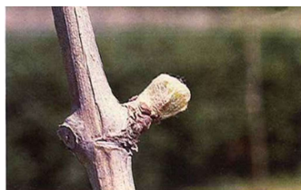
Punta verde (Estado C)