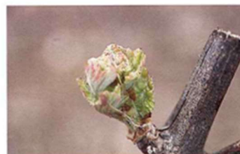
Hojas incipientes (Estado D)