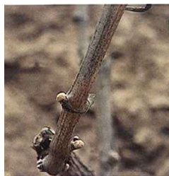
Yema hinchada (Estado B 2 )